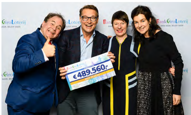
Goed Geld Gala van de BankGiro Loterij

van de tentoonstelling KinderRadioFabriek en het hoorspel Stemfraude.