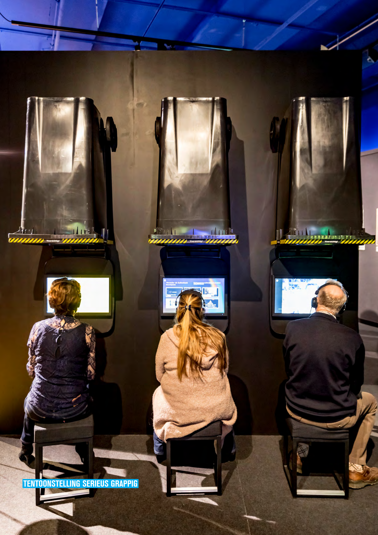
TENTOONSTELLING SERIEUS GRAPPIG