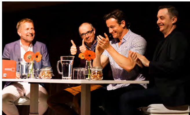
De cast van Koefnoen tijdens een 'satirisch avondje uit'

De middelen uit het BIS en Erfgoedwet zijn ook in 2019 gezet voor activiteiten rondom de presentatie van de collectie van het Permuseum. Een groot deel van de activiteiten vond zijn weerslag