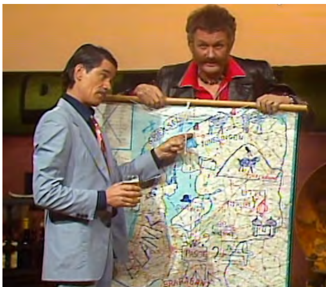
De 'herindelingskaart' van Van Kooten en De Bie