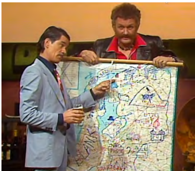
De 'herindelingskaart' van Van Kooten en De Bie